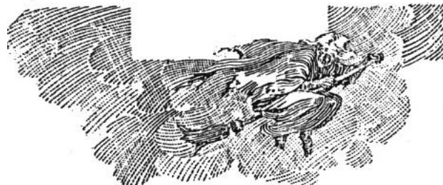
Table des matières du " Diable en Belgique " Roberto J. PAYRO (ou Payró ) : IEA3637 PARTIE 1 (pages I-37 : "LE DIABLE ARCHITECTE", "UNE CREATURE D'APOCALYPSE" (LE "VERT-BOUC"), "LE PACTE AVEC LE DIABLE", "LE STRATAGEME DE SAINT-REMACLE", "LE TILLEUL DES PENDUS" et "LE SORCIER DU CONDROZ".) :